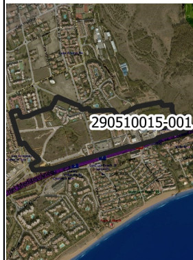
Mapa de la zona