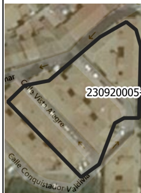
Mapa de la zona