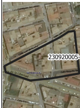
Mapa de la zona