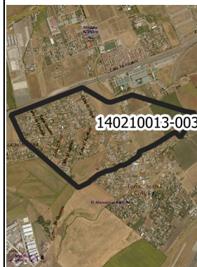
Mapa de la zona