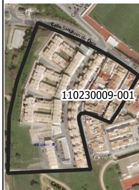
Mapa de la zona